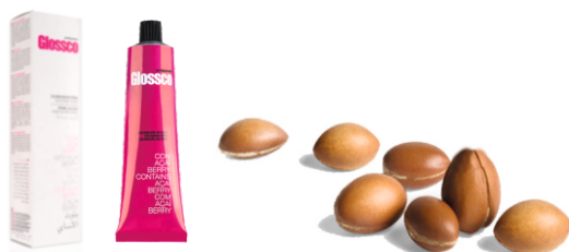
BALENIE: 100 ml